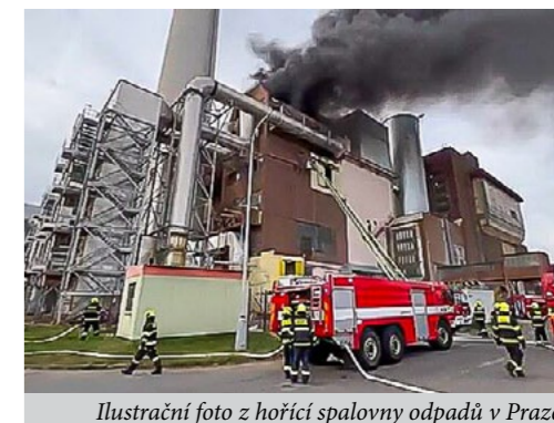
Ilustrační foto z hořící spalovny odpadů v Praze

Mnoho toxických látek, které spalovny odpadů produkují se vůbec neměří a ani na ně nejsou limity nebo filtry, např. velmi nebezpečné látky PFAS, tzv. věčné chemikálie, které vydrží v přírodě tisíce let. Spalovny do ovzduší uvolňují také polévatý prach částice PM10 a PM 2,5, které mohou dle WHO způsobovat různé vážné zdravotní problémy, předčasně porodit a nižší porodní hmotnost kojenců. Tyto látky už dnes překračují v Písku doporučené limity a spalovna to zhorší. Částice menší než 10 µm (PM10) se mohou usazovat v průduškách, menší částice mohou vstupovat přímo do plicních sklípků, proto jsou tyto částice nejnebezpečnější. Na jemnou frakci suspendovaných částic se váží nebezpečné PAU (polycyklické aromatické uhlovodíky), které jsou často mutagenní a karcinogenní. Vliv polévatého prachu na naše zdraví je zásadní. Způsobuje řadu zdravotních komplikací, např. astma, má nepříznivé účinky na kardiovaskulární systém, často vede k nevratným genetickým změnám, rako-