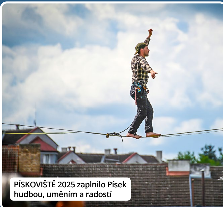
PÍSKOVIŠTĚ 2025 zaplnilo Písek hudbou, uměním a radostí

POZVÁNKY: Duhové divadlo waldorfských škol opět rozzáří město Písek – 4. - 7. června