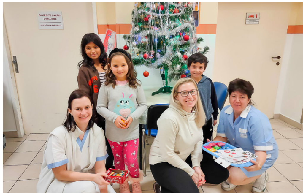
Návštěva dětí z NADĚJE v Nemocnici Písek 20. prosince. Příjemnou předvánoční atmosféru podpořily zdravotní sestřičky spolu se sociální pracovníci nemocnice Písek.