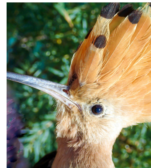
Portrét autorem chycené samice

Tento text je ukázkou proměny českého jazyka, ale i krajiny a vztahu společnosti k ptactvu. Dozvídáme se z něho, že kolem Písku byly rozsáhlé pastviny a mokřé louky, tedy přírodní prostředí, které tomuto druhu jistě víc vyhovovalo než to současné. I tak byl dudek v 19. století v Českých zemích ptákem vzácně hnízdícím. Výjimku tvořilo