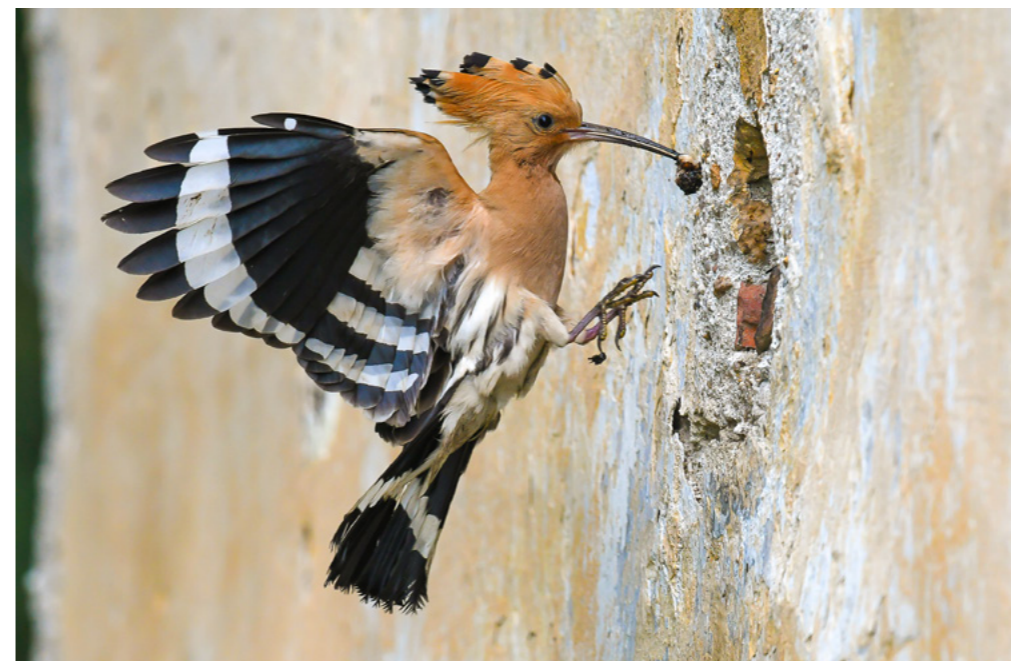
Štít domu, kde hnízdila kroužkovaná samice – samec přilétá s krméním pro osířelá mláďata.

Od prvního prokázaného zahnízdění dudka na Písecku v roce 1965 ke druhému v roce 2015 uběhlo 50 let. To první prokázal můj nejdřív ptákovědecký učitel a posléze kamarád Milan Hirt a to druhé jeho pilný a učenlivý žák, tedy já. Rok 2015 byl zřejmě pro jihočeské dudky z nějakého důvodu