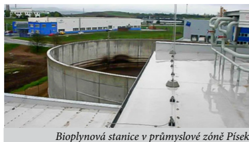
Bioplynová stanice v průmyslové zóně Písek

Dále si stojím za informací, že na čistírně po instalaci zařízení na rekuperaci tepla o výkonu 5 MW by bylo možno získat 120.000 GJ a to při výši investice, která je sice významná, ale stále jen 25 % plánované investice do ZEVO. Nehledě na