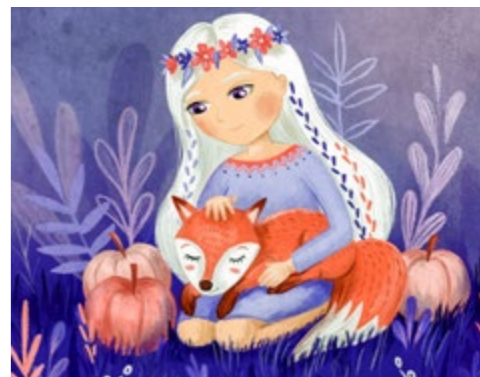
V pátek 2. prosince představí svou tvorbu písecká grafička a ilustrátorka Kateřina Kofroňová.

Neděle 4. prosince, 14:30: ČERT A KÁČA Neděle 11. prosince, 14:30: VÁNOČNÍ KOLEDA – vánoční příběh ze staré Anglie. Vstup 50 Kč, Bakaláře 43/6 (vedle Charity).