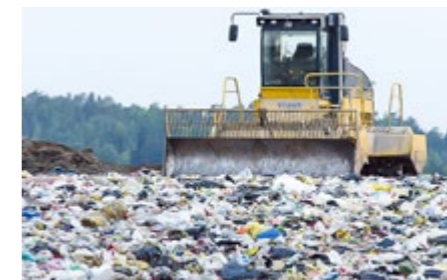
CHTĚJÍ PÍSEČÁCI SPALOVNU? Jak vyjádřit nesouhlas se spalovnou odpadů ZEVO plánovanou u Smrkovic a souhrn základních faktů můžete najít na www.piseckysvet.cz , nebo získat e-mailem na adrese: bausting@seznam.cz – je to možné do 5. 12. 2022.