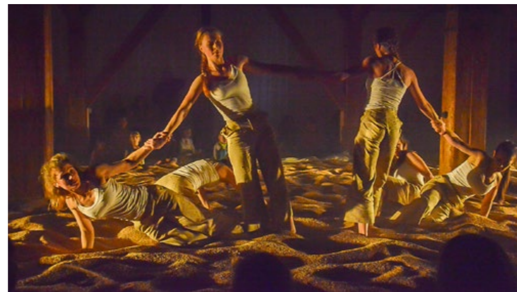
UNIKÁTNÍ PŘEDSTAVENÍ ZRNĚNÍ připravila Sladovna Písek. Je vhodné pro každého od 5 do 99 let. Vzniklo pod vedením Matěje Matějky ve spolupráci s Adamem Langerem, Petrou Peškovou, Gabrielou Kroutilovou, Lukášem Urbancem, Sladovnou Písek a tanečnicemi z T-Dance. Vstupenky za 170,- Kč na webu a recepci Sladovny, reprízy: 4. 12. od 17:30 hodin a 18. 12. od 15 hodin.