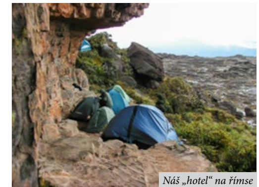
Náš „hotel“ na rímse

Byl jsem jako utržený ze řetězu. Jak jsem tak běhal po nejbližším okolí a snažil se zdokumentovat co možná všechny roraimské bizarnosti, tak jsem si přitom nevíšiml, že od Gran Sabany pod námi se přibližuje stěna temných mraků. Sem tam byly vidět i bílé závěsy lijáků.