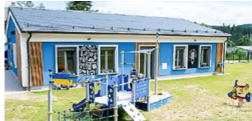
Vimperská firma Rohde Schwarz získala před pár dny cenu za nejlepší personální projekt roku 2022, mj. za dětskou skupinu „Koumáčci“ – Královská školka.

Rozdíl mezi klasičnou školkou a námi je v tom, že zatímco běžné školky spadají pod ministerstvo