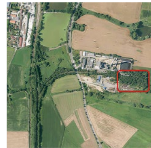
Zákres umístění budoucího záměru spalovny odpadu vedle stávající teplárny u Smrkovic

Tvrzení, že spalovny budou muset brzy platit emisní povolenky, není zcela správné. Zařízení