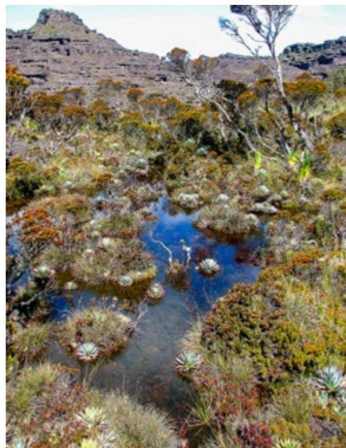
Část dešťové vody napájí skalnaté prohlubně