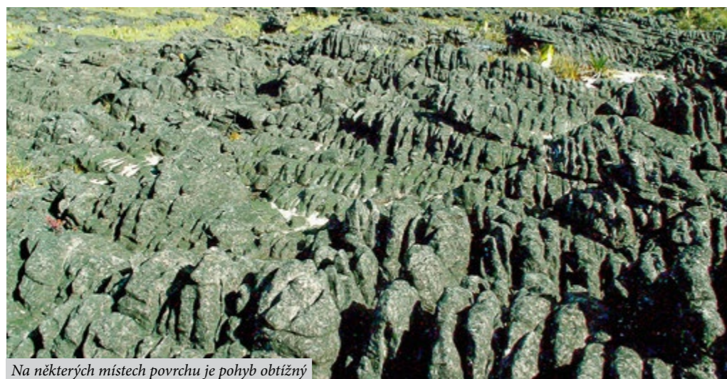
Na některých místech povrchu je pohyb obtížný