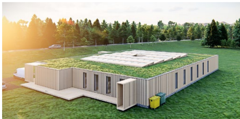
Vizualizace budovy budoucí Základní a střední svobodné lesní školy Ráj, která by měla vyrůst v Malých Nepodřicích u Písku – vpravo nahoře vizualizace interiéru.